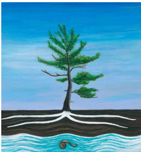
Une représentation rotinohsyón:ni du concept de respect