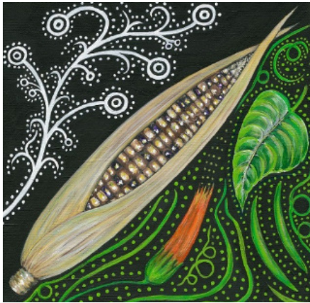
Une représentation rotinonhsyón:ni du concept d'intégrité