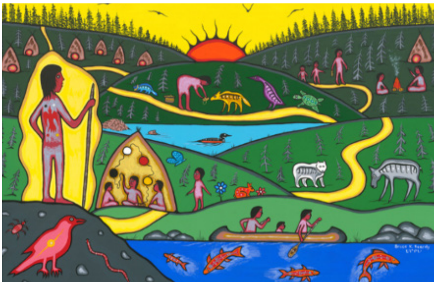
Une représentation de la norme d'exercice Norme de perfectionnement professionnel continu

Les membres savent que le perfectionnement professionnel continu fait partie intégrante d'une pratique efficace et influence l'apprentissage des élèves. Les connaissances, l'expérience, les recherches et la collaboration nourrissent la pratique professionnelle et pavent la voie de l'apprentissage autonome.