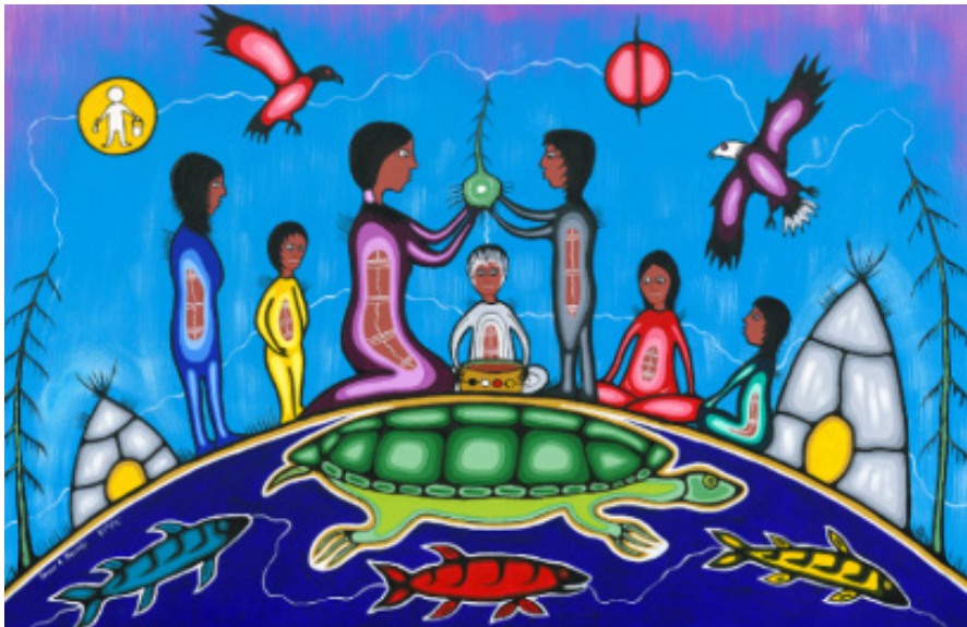
Une représentation de la norme d'exercice Engagement envers les élèves et leur apprentissage

Les membres se soucient de leurs élèves et font preuve d'engagement envers eux. Ils les traitent équitablement et respectueusement et sont sensibles aux facteurs qui influencent l'apprentissage de chaque élève. Les membres encouragent les élèves à devenir des citoyennes et citoyens actifs de la société canadienne.