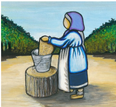
Une représentation rotinohsyón:ni du concept d'empathie