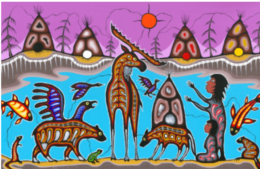
Une représentation de la norme d'exercice Leadership dans les communautés d'apprentissage

Les membres encouragent la création de communautés d'apprentissage dans un milieu sécuritaire où règnent collaboration et appui, et y participent. Ils reconnaissent la part de responsabilité qui leur incombe et assument le rôle de leader afin de favoriser la réussite des élèves. Les membres respectent les normes de déontologie au sein de ces communautés d'apprentissage et les mettent en pratique.