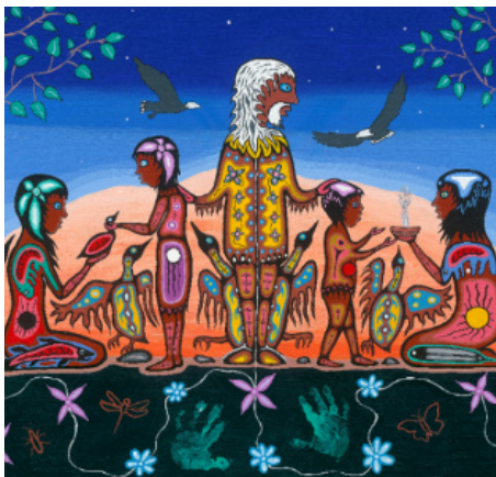
Une représentation anishinaabe du concept de respect

La confiance et l’objectivité sont intrinsèques au concept de respect. Les membres honorent la dignité humaine, le bien-être affectif et le développement cognitif. La façon dont ils exercent leur profession reflète le respect des valeurs spirituelles et culturelles, de la justice sociale, de la confidentialité, de la liberté, de la démocratie et de l’environnement.