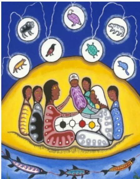
Une représentation anishinaabe du concept d'intégrité

Le concept d'intégrité comprend l'honnêteté, la fiabilité et la conduite morale. Une réflexion continue aide les membres à agir avec intégrité dans toutes leurs activités et leurs responsabilités professionnelles.