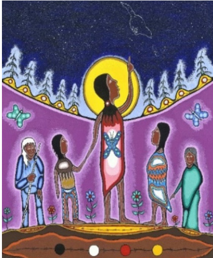
Une représentation anishinaabe du concept d'empathie

Le concept d'empathie comprend la compassion, l'acceptation, l'intérêt et le discernement nécessaires à l'épanouissement des élèves. Dans l'exercice de leur profession, les membres expriment leur engagement envers le bien-être et l'apprentissage des élèves par l'influence positive, le discernement professionnel et le souci de l'autre.