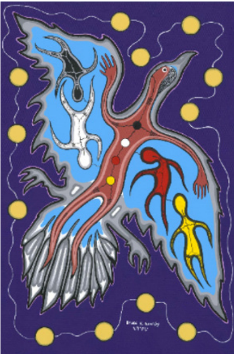
Une représentation de la norme d'exercice Pratique professionnelle

Les membres de l'Ordre s'appuient sur leurs connaissances et expériences professionnelles pour diriger les élèves dans leur apprentissage. Ils ont recours à la pédagogie, aux méthodes d'évaluation, à des ressources et à la technologie pour planifier leurs cours et répondre aux besoins particuliers des élèves et des communautés d'apprentissage. Les membres peaufinent leur pratique professionnelle et cherchent constamment à l'améliorer par le questionnement, le dialogue et la réflexion.