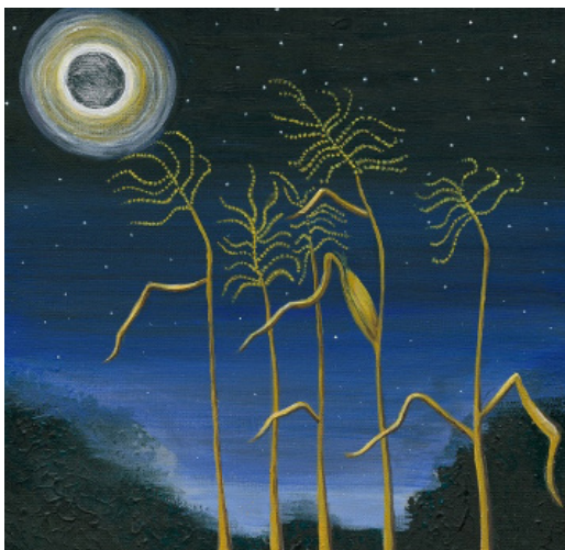
Une représentation rotinohsyón:ni du concept de confiance