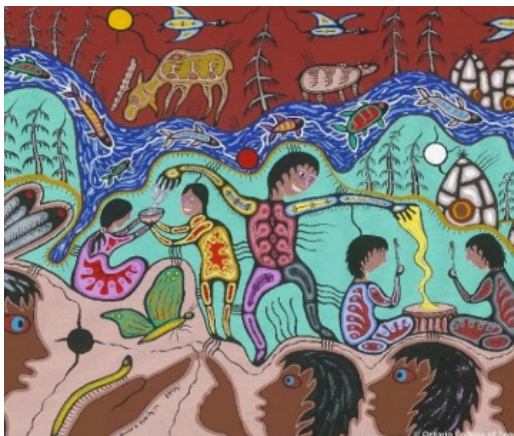
Une représentation anishinaabe du concept de confiance

Le concept de confiance incarne l'objectivité, l'ouverture d'esprit et l'honnêteté. Les relations professionnelles des membres avec les élèves, les collègues, les parents, les tutrices et tuteurs ainsi que le public reposent sur la confiance.